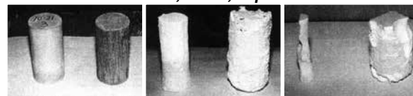
Antes de la Inmersión 5 Semanas Después 10 Semanas Después

El mortero tratado con Xypex y otro sin tratamiento se sometieron a prueba de resistencia al ácido siendo expuestos a una solución de 5% H 2 SO 4 durante 100 días. Xypex disminuyó la erosión del concreto hasta 1/8vo respecto a las muestras de referencia.